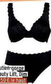
Soutien-gorge Beauty Lift, Dim 29,50€ le haut & 15,50€ le bas