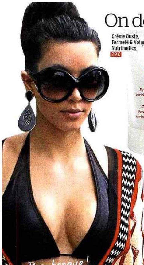
Bombesque! Kim Kardashian

Étape 3 : artifice spécial décolleté. Le Dim Beauty Lift est un soutien-gorge innovant à effet modelant qui permet de remonter, recentrer et maintenir les seins naturellement. Pour un décolleté plongeant, les soutifs adhésifs font des miracles!