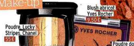
Poudre Lucky Stripes, Chanel 55€