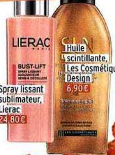
Spray lissant sublimateur, Lierac 24,80€