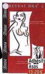
Adhésifs poitrine, Asos 13,20€