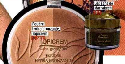
Poudre hydra bronzante, Topicream 15,50€